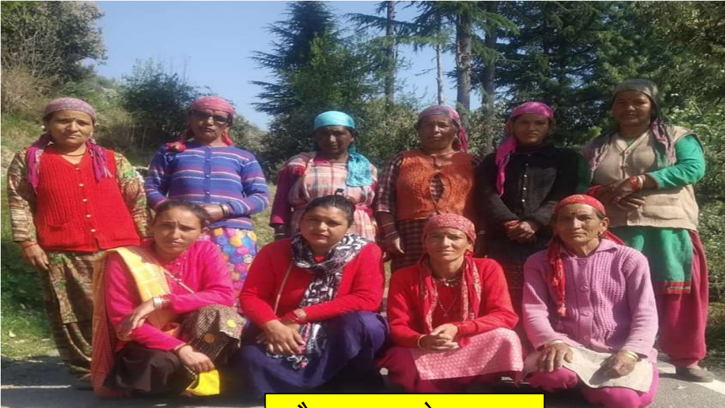
वैष्णू समूह के सदस्य