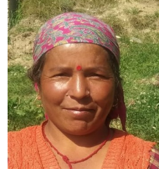
श्रीमति तारामणी सदस्य